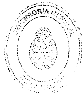
STELLA MARIS MARTÍNEZ DEFENSORA GENERAL DE LA NACIÓN

Protocolícese, hágase saber y, oportunamente, archívese.